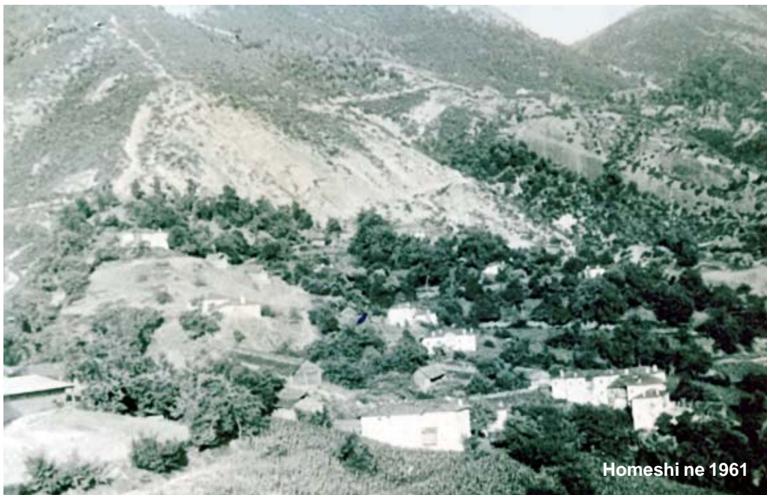
Homeshi ne 1961

Botërore në fillimet e Luftës së Dytë Botërore si dhe zhvillimet pas viteve 1940 deri në vitin 1990 si dhe lëvizjen e popullsisë pas viteve 1990 (në periudhën e tranzicionit) deri në fund të 2008-tës, me qëllim, që sadopak do të shërbejë për moshumbjen e origjinës dhe të identitetit të secilit fis e person, që ka lëvizur.