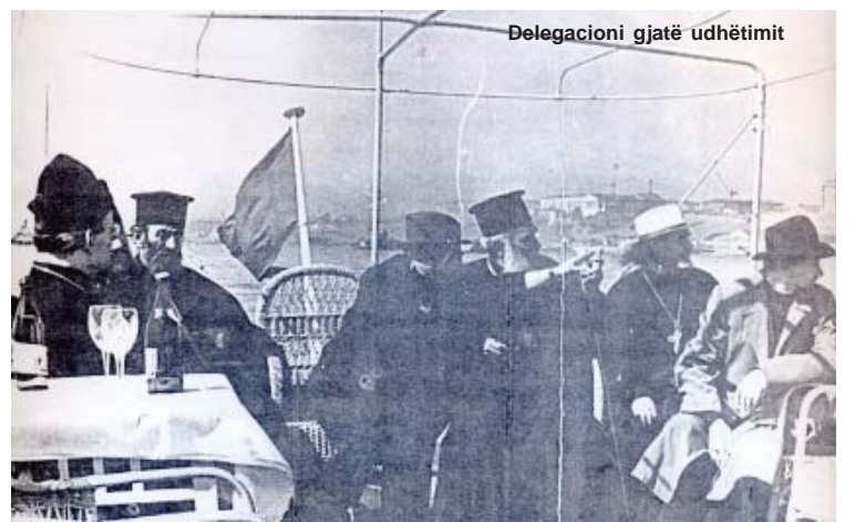
Delegacioni gjatë udhëtimit

zakoneve shqiptare në Varna K. Kricik ve në dukje se shqiptarët krishterë-ortodoks në këtë vend flasin shqip por nuk e shkruajnë në gjuhën shqip, nga që nuk ka shkollë për të mësuar shqip.