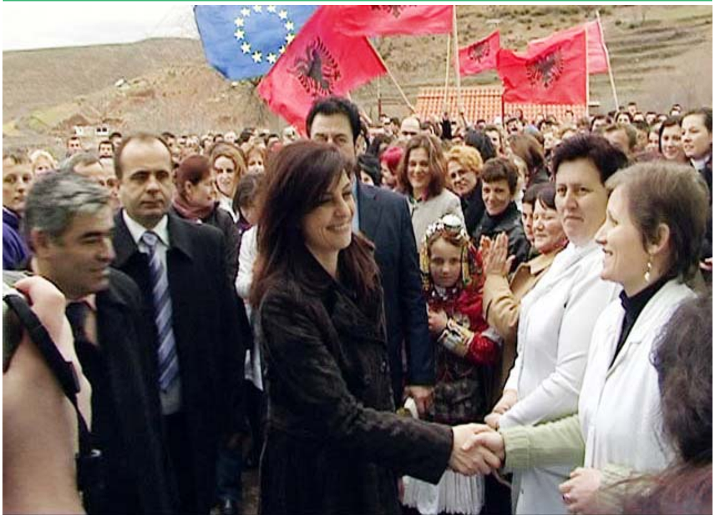
KRYEPARLAMENTARJA JOZEFINA TOPALLI TAKON DHE URON NXËNËSIT E MËSUESIT E SHKOLLËS SË RRAJCËS, ME RASTIN E 7 MARSIT, FESTËS SË MËSUESIT