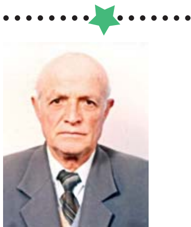
Nga Ramadan GJATA

H omeshi nga pozita gjeografike ndodhet rreth 20 km në veri-perëndim të qytetit të Pogradecit dhe si pjesë veri-lindore e Mokrës. Është vendosur në një luginë, që rrethohet nga kodra e male të larta nga 500-1500 metra të larta (Haishta e Gegës) ku sot është vendosur Antena e televizionit. Nga gojëdhënat e bisedat me historianë të ndryshëm emrat e fiseve që ekzistojnë si dhe toponimet sot të bëjnë të mendosh se është themeluar nga banorë të ardhur nga zonat veriore rreth fundit të shekullit të XIV dhe fillimit të shek.XV dhe emri i fshatit Homesh vjen nga latinishtja (Homes). Fiset që janë vendosur të parët kanë qenë Gjatat, Bizjonat, Pengut, Damet, Minkshat pak më vonë dhe Çollarët me besime të krishterizmit dhe kohë pas kohe disa nga fiset kanë ngritur edhe institucionet e kultit fetar si Bizgjanat, Pengut e Damot. Shkaqet që i kanë detyruar të vendosin në atë luginë mbrojtja nga invazionet e luftërave të kohës si dhe mbrojtja e besimeve fetare ky vend (Homeshi) ka shërbyer edhe si pikë grumbullimi nga pikëpamje strategjike, i forcave luftarake të Mokrës për t'u dalë para ushtrive turke që vinin nga Manastiri, Ohri e të futeshin në territorin shqiptar nga Qafë-Thana. Kjo konkretizohet edhe me trashëgiminë e folklorit mokrar brez pas brezi kur Gjergj Golemi i bën thirrje udhëheqësit të krahinës së Mokrës, Angjerinit, që luftëtarët e Mokrës të grumbullohen tek Gurët e gjete (Gurët Olies) pranë fshatit Homesh: