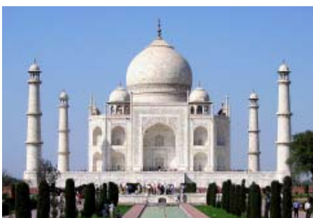
"Taxh Mahalli", mrekullia e ndërtuar nga një shqiptar

Në mesin e 60 krijimeve krijimi "Thikat e Vardarit" iu botuar edhe në faqet e gazetës "Mokra", u vlerësua nga krijuesit dhe në fund autori fitoi çmimin e tretë.