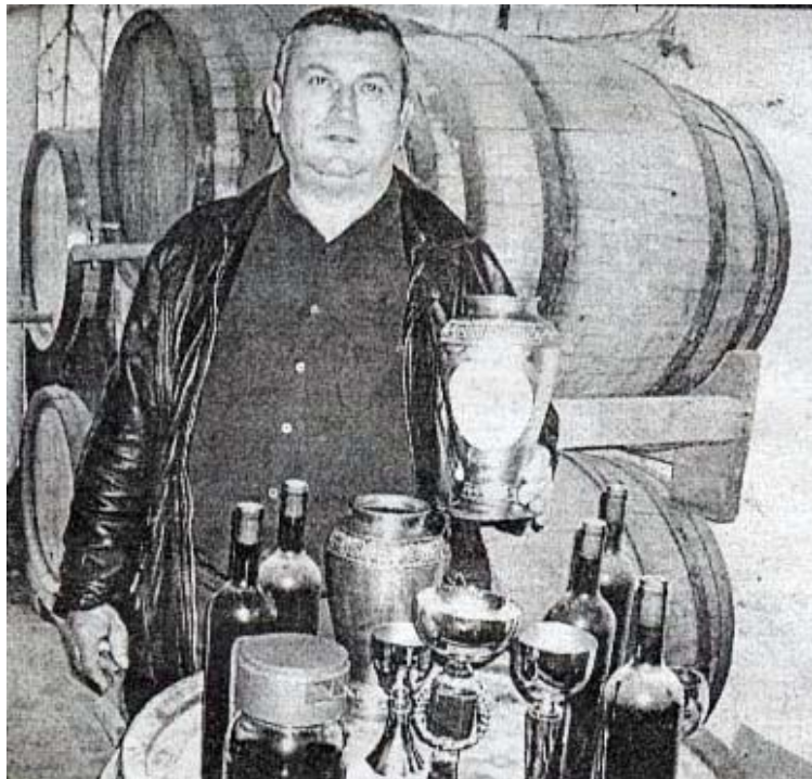
FITUESI I CIMIMIT TE VERES ME TE MIRE