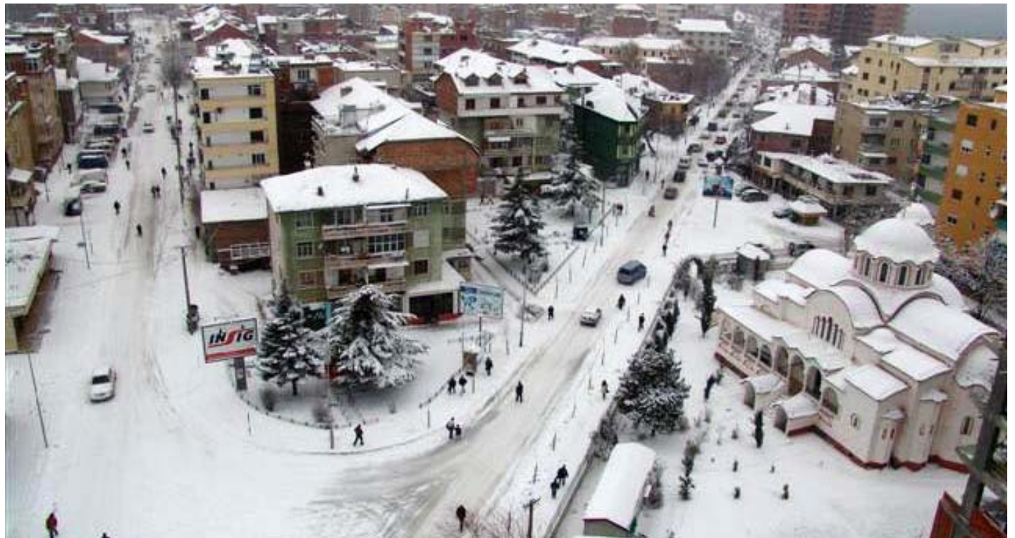
Ndodhet në Qarkun e Korçës. Përfshin: Qytetin e Pogradec dhe 7 Komuna, Trebinjë, Çërravë, Dardhas, Velçan, Porptisht, Buçimas, Udënisht