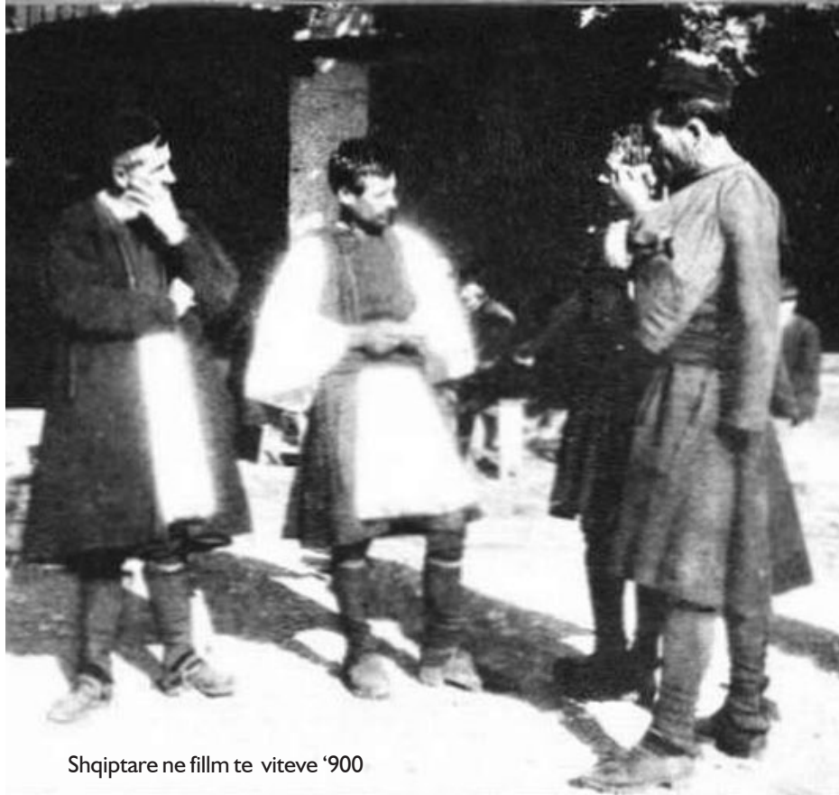
Shqiptare ne fillm te viteve '900

Më 1902 në vendin tonë u ndërtua rruga për lëvizje me anën e kafshëve dhe qerreve. Kjo rrugë fillonte nga Manastiri – Korçë – Janinë me një gjatësi 200 kilometra Inxhinjeri Italian që merrej me caktimin dhe matjen e rrugëve shpërblehej (30 qindarka ari ose flori) për kilometër. Gjithsej mori 2600 napolona ari. Punësimin e rrugës, si gjërmime, çeljen e kanaleve dhe thyerjeve, shtrimin e çakullin e