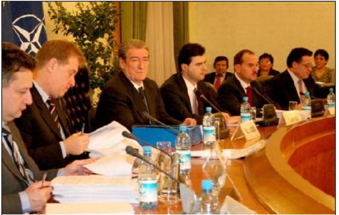
Kabineti Berisha 1

Në fund të fundit integrimin evropian shumica e shqiptarëve e kuptojnë si lëvizje e lirë, pra si emigracion, dmth si mundësi për t’u punësuar jashtë shtetit