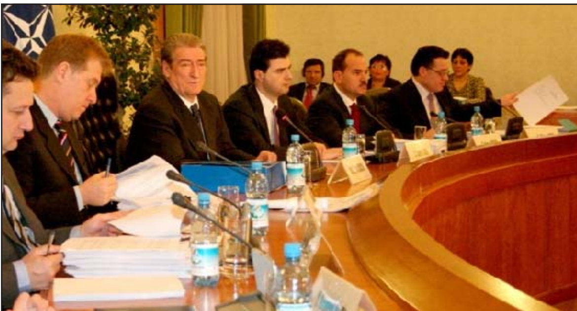
Kabineti Berisha 1