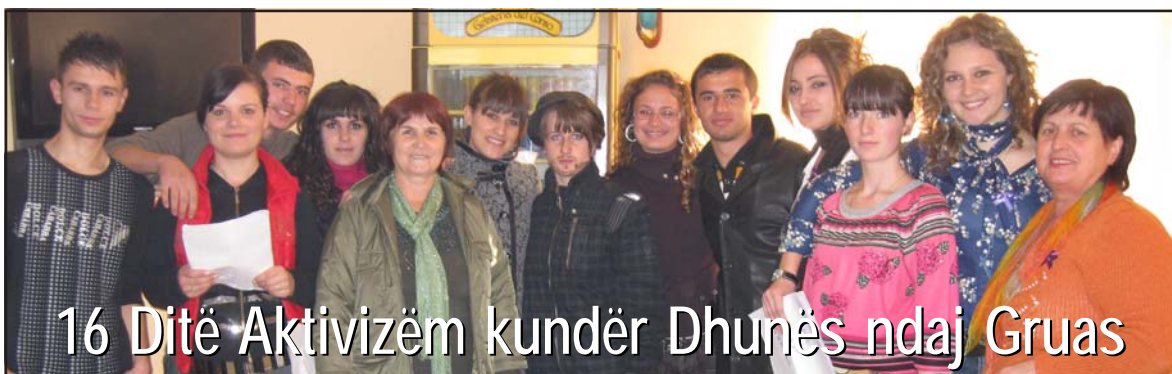
16 Ditë Aktivizëm kundër Dhunës ndaj Gruas